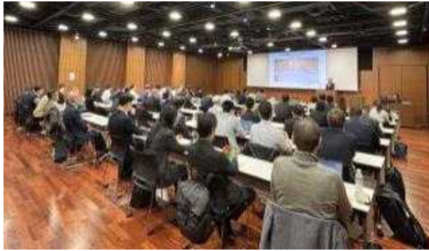
KCA 창업기업(3개사) 피칭