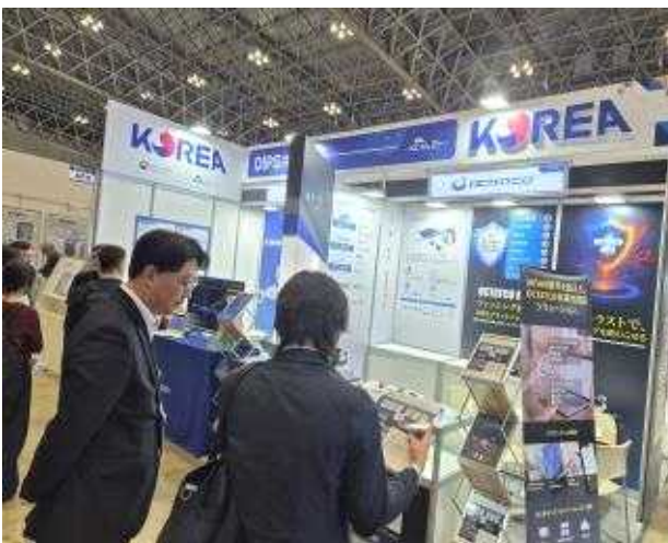
한국관 창업기업 부스 지원