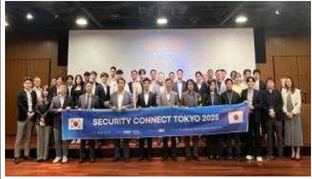
JNSA 및 일본 파트너사 네트워킹